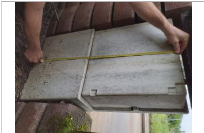
74 cm du bas en haut du coffret

Pérennité : Aucune État du repère : Mauvais