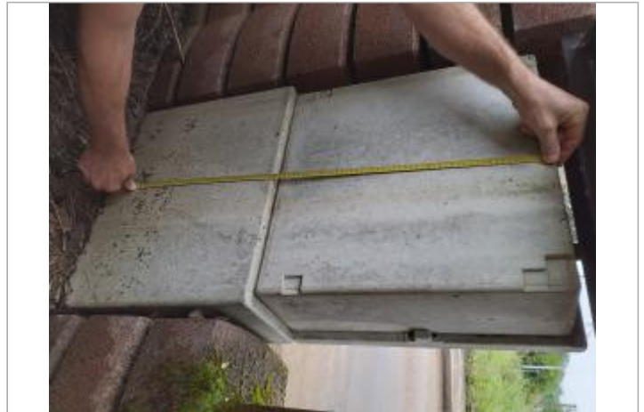
74 cm du bas en haut du coffret