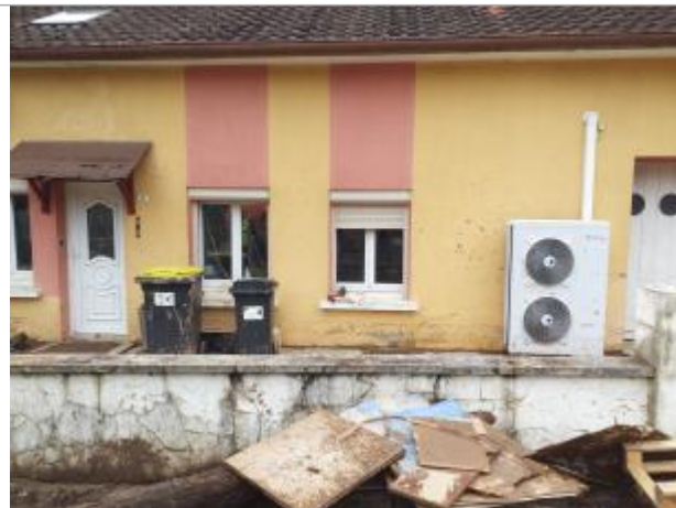
3 rue de Malval