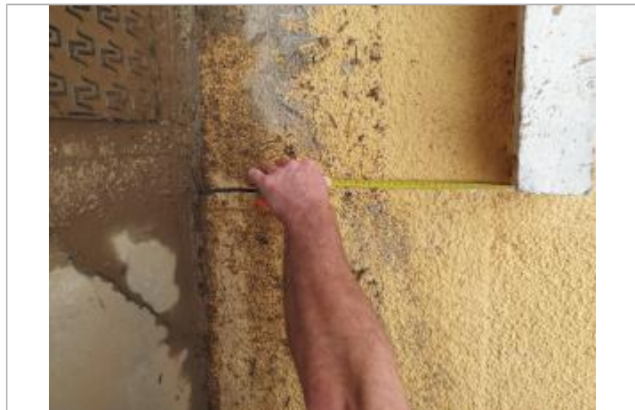
26 cm sous la tablette de la 2ème fenêtre à droite de la porte d'entrée