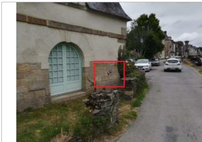
Pignon du château du Mail