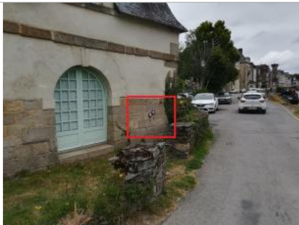
Pignon du château du Mail