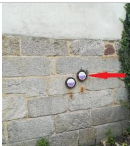
Repère normalisé de la crue de janvier 1995

Altitude calculée de l'eau (en m) : 5.16 m