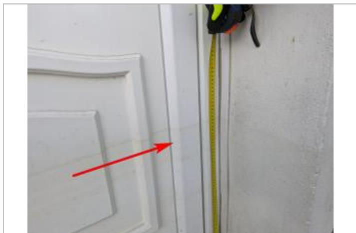
marque sur la porte

Altitude calculée de l'eau (en m) : 21.071