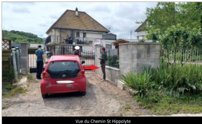
Vue du Chemin St Hippolyte