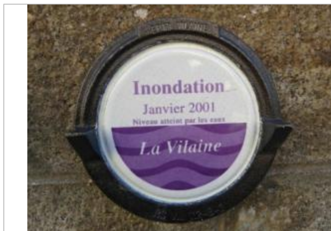
Repère normalisé de la crue de janvier 2001

Altitude calculée de l'eau (en m) : 5.38 m