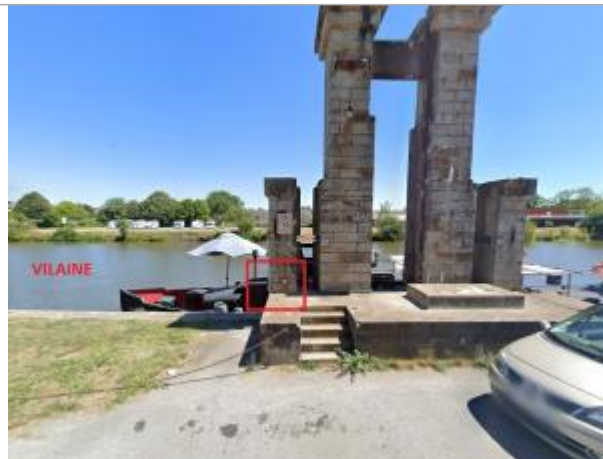
Pile de l'ancien barrage