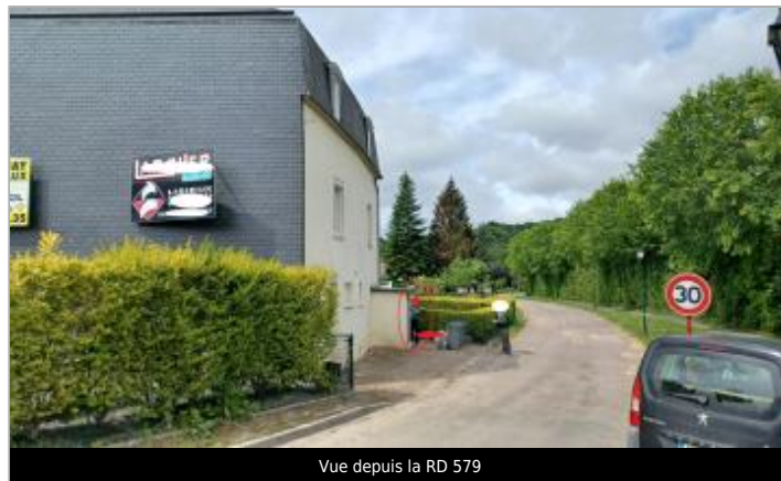
Vue depuis la RD 579

GÉOLOCALISATION Coordonnées WGS84 : X: 0.21587058 / Y: 49.11045760 Coordonnées RGF93 (Lambert 93) X: 496755.52 / Y: 6893654.77 Coordonnées RGF93 (ETRS89) : X: 0.2158706 / Y: 49.1104576 Code Hydro: I0-0200 Rive de référence: Gauche