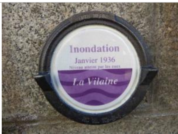
Repère normalisé de la crue de janvier 1936

Altitude calculée de l'eau (en m) : 5.42