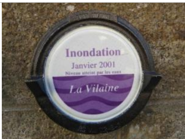
Repère normalisé de la crue de janvier 2001

Altitude calculée de l'eau (en m) : 5.38