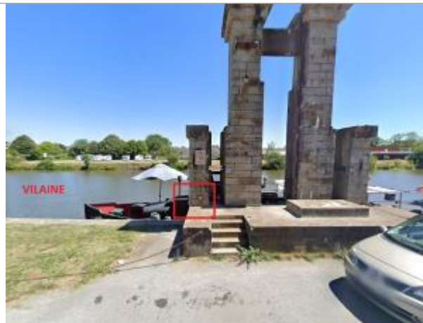
Pile de l'ancien barrage