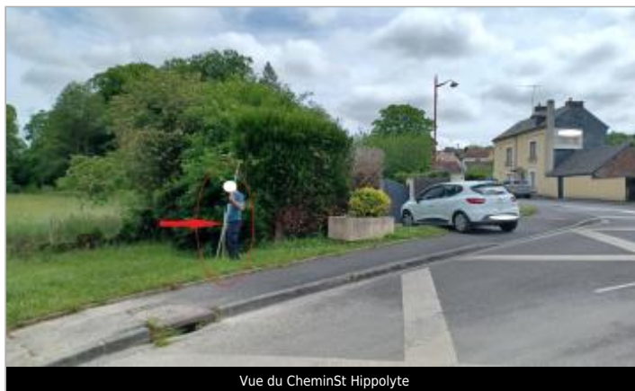
Vue du Chemin St Hippolyte