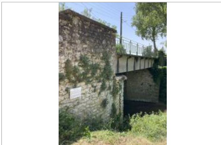
Vue du site, auteur : SMMAR, 2024