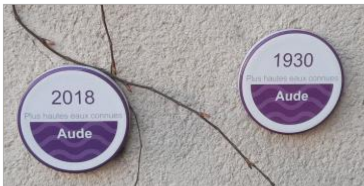
Vue du repère, auteur : SMMAR, 2024