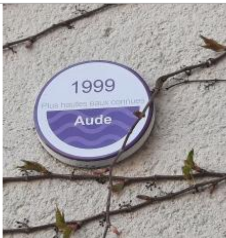
Vue du repère, auteur : SMMAR, 2024