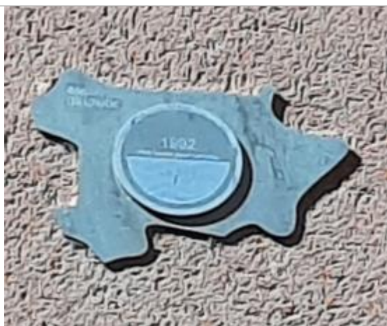
Vue du repère, auteur : SMMAR, 2024