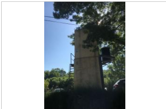
Vue du site, auteur : SMMAR, 2024