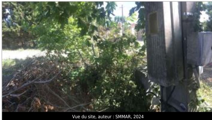
Vue du site, auteur : SMMAR, 2024

Coordonnées WGS84 : X: 3.03872000 / Y: 43.22316000