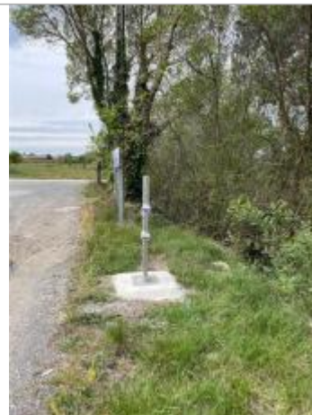
Vue du site, auteur : SMMAR, 2024