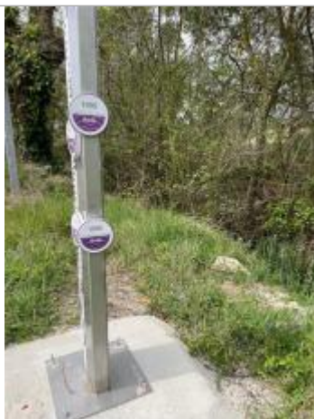
Vue du repère, 2024