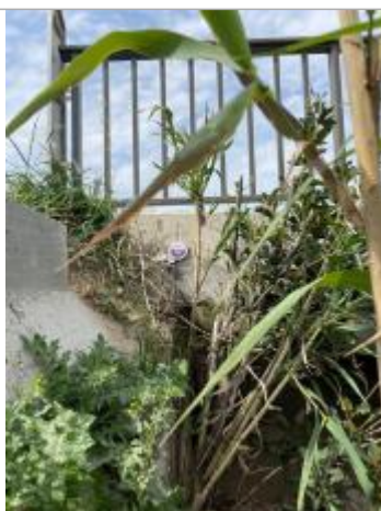
Vue du repère, auteur : SMMAR, 2024