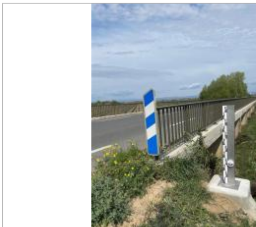
Vue du site, auteur : SMMAR, 2024

Coordonnées WGS84 : X: 3.00399000 / Y: 43.23001000