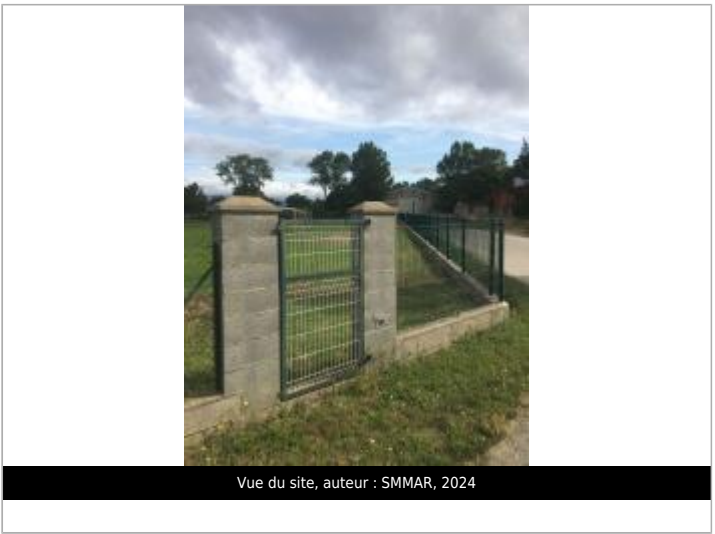
Vue du site, auteur : SMMAR, 2024