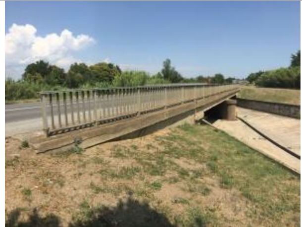
Vue du site, auteur : SMMAR, 2024

Coordonnées WGS84 : X: 2.76752000 / Y: 43.20218000