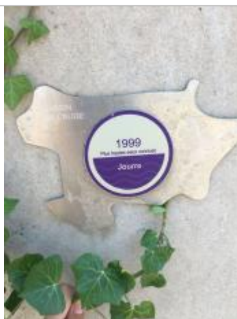
Vue du repère, auteur : SMMAR, 2024