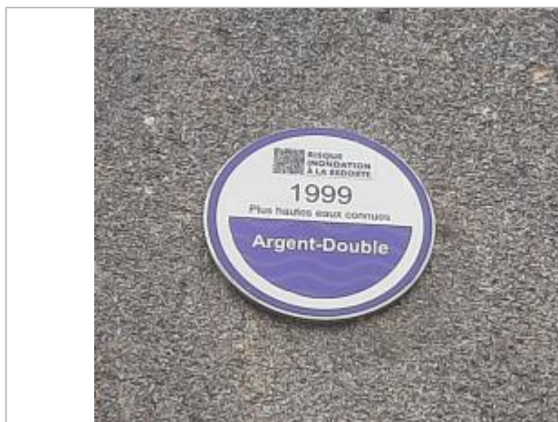
Vue du repère, auteur : SMMAR, 2024