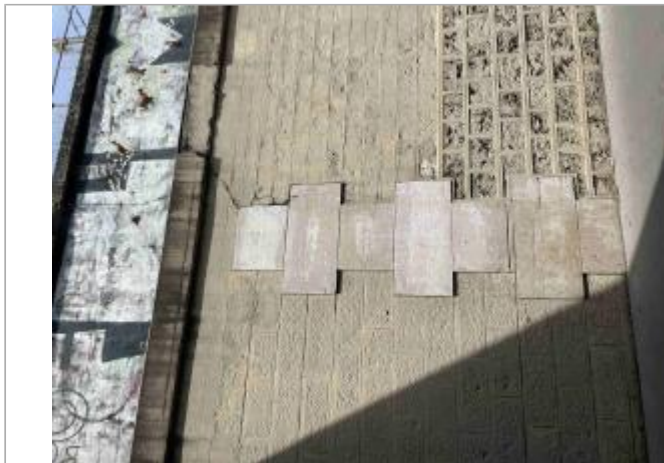
Marque sur le mur du tunnel de la rue Proudhon