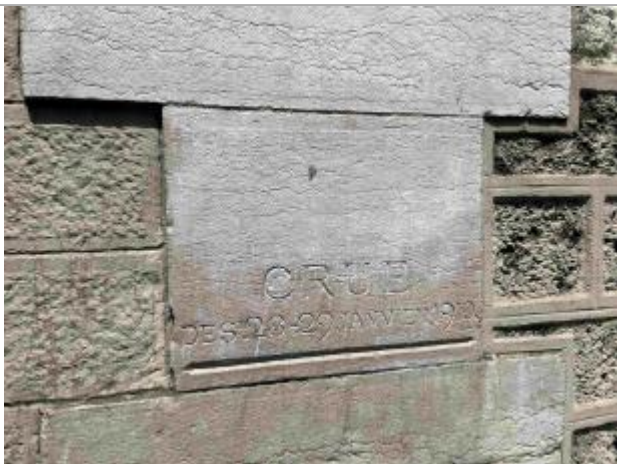
Repère de crue "Crue des 28-29 janvier 1910"