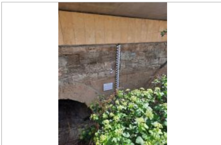
Vue du site, auteur : SMMAR, 2024