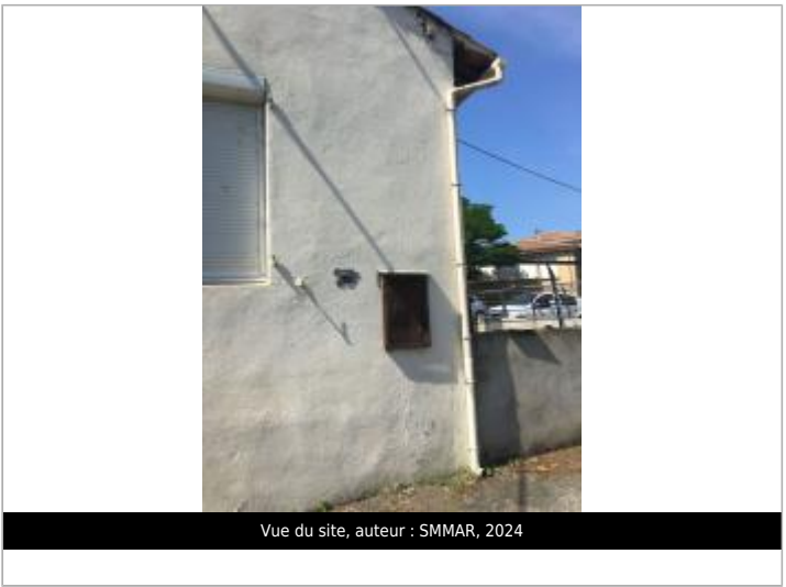
Vue du site, auteur : SMMAR, 2024