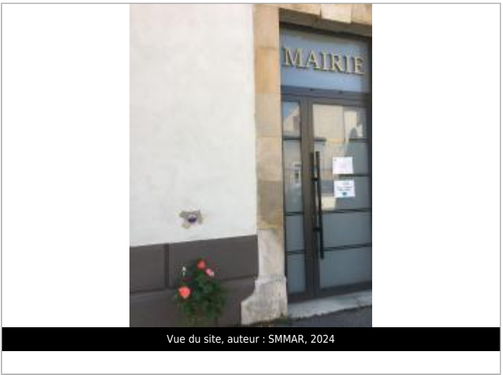
Vue du site, auteur : SMMAR, 2024