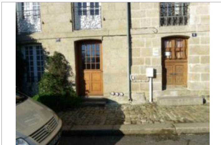
Maison au 7 quai Duguay Trouin