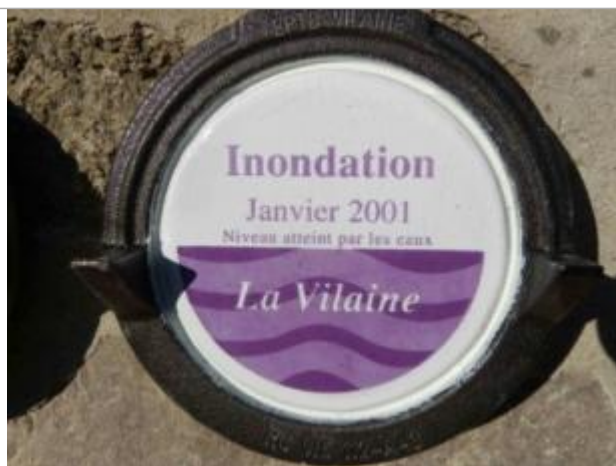
Repère normalisé de la crue de janvier 2001

Altitude calculée de l'eau (en m) : 5.34 m