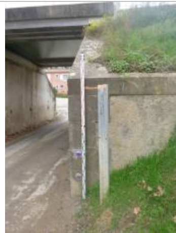
Berge rive droite