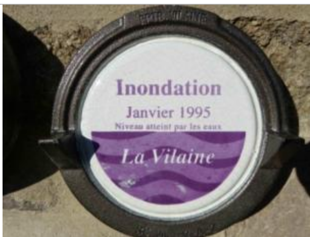
Repère normalisé de la crue de janvier 1995

Altitude calculée de l'eau (en m) : 5.35 m