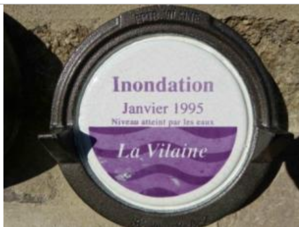
Repère normalisé de la crue de janvier 1995

Altitude calculée de l'eau (en m) : 5.35 m