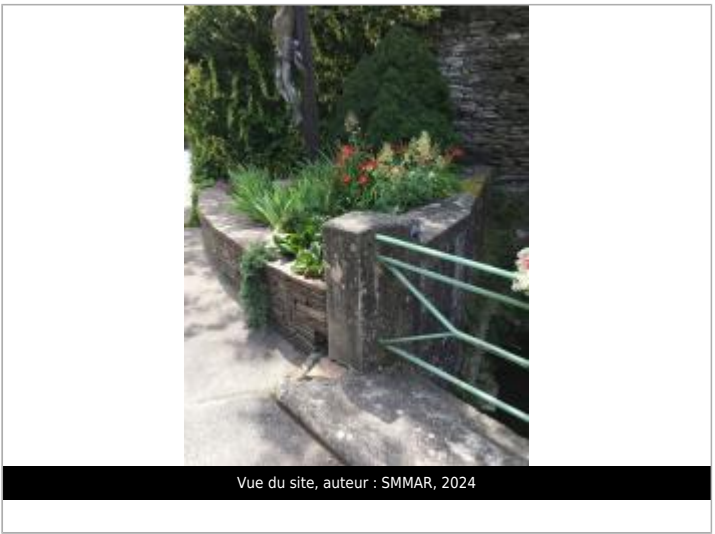
Vue du site, auteur : SMMAR, 2024