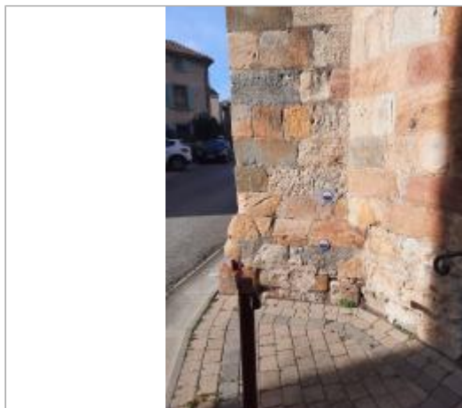
vue de l'église avec les différents repères

Coordonnées WGS84 : X: 2.84766891 / Y: 43.22944730