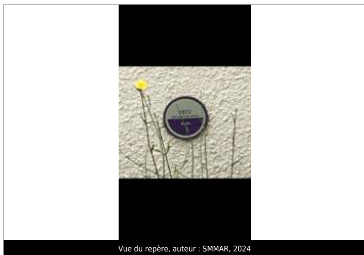
Vue du repère, 2024