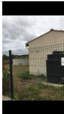
Vue du site, auteur : SMMAR, 2024