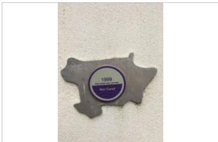
Vue du repère, auteur : SMMAR, 2024