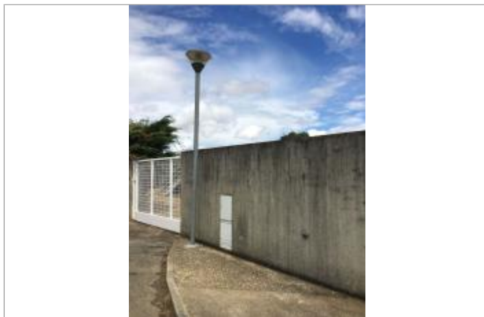
Vue du site, auteur : SMMAR, 2024

Coordonnées WGS84 : X: 2.53905000 / Y: 43.22867000