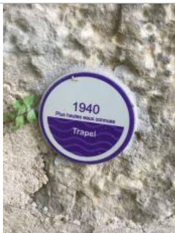
Vue du repère, auteur : SMMAR, 2024

Altitude calculée de l'eau (en m) : 110.71