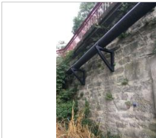
Vue du site, auteur : SMMAR, 2024

Coordonnées WGS84 : X: 2.37533000 / Y: 43.25765000