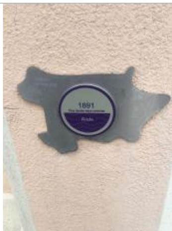
Vue du repère, auteur : SMMAR, 2024