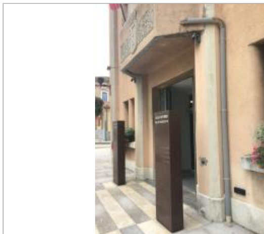
Vue du site, auteur : SMMAR, 2024

Coordonnées WGS84 : X: 2.44282000 / Y: 43.20942000