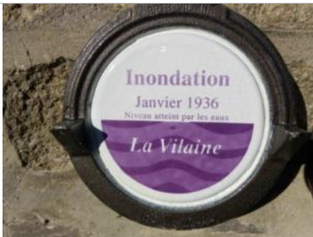
Repère normalisé de la crue de janvier 1936

Altitude calculée de l'eau (en m) : 5.38 m