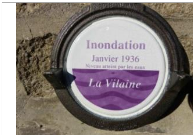
Repère normalisé de la crue de janvier 1936

Altitude calculée de l'eau (en m) : 5.38 m