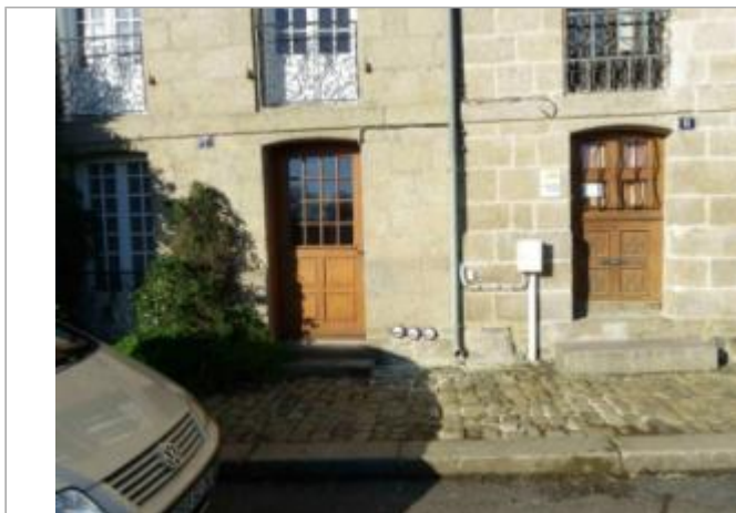
Maison au 7 quai Duguay Trouin

Coordonnées WGS84 : X: -2.08508891 / Y: 47.64764200