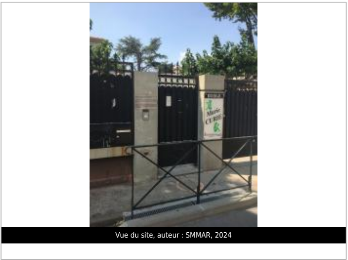
Vue du site, auteur : SMMAR, 2024