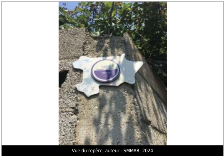
Vue du repère, 2024