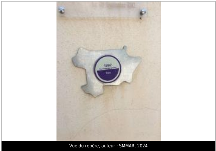
Vue du repère, auteur : SMMAR, 2024