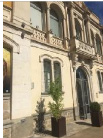
Vue du site, auteur : SMMAR, 2024