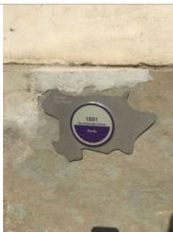
Vue du repère, 2024