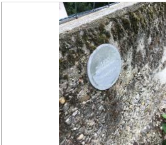
Vue du repère, 2024