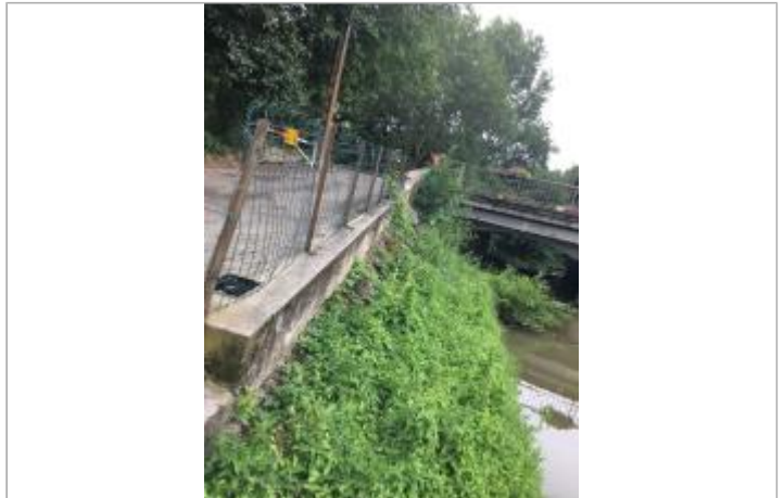
Vue du site, auteur : SMMAR, 2024

Coordonnées WGS84 : X: 2.18038000 / Y: 43.25502000