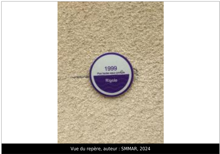
Vue du repère, auteur : SMMAR, 2024