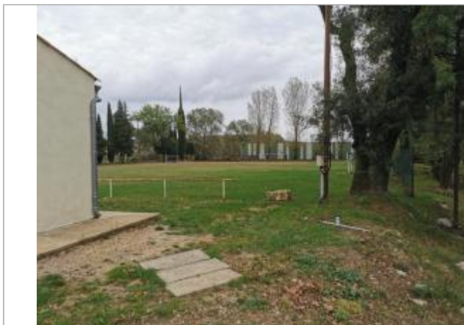
Vue du site, auteur: OTEIS, 2023