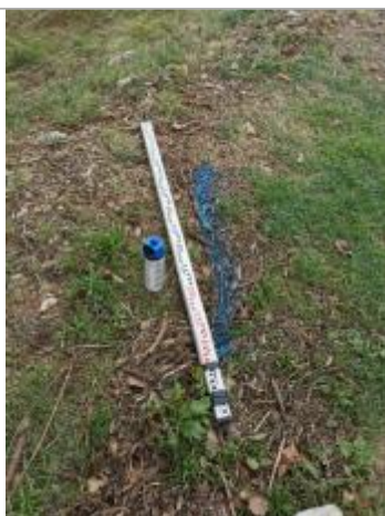
Vue du repère, auteur: OTEIS, 2023