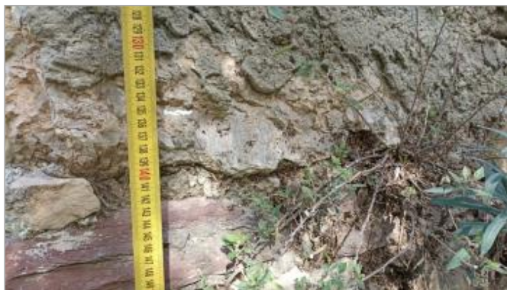
Vue du repère, auteur: OTEIS, 2023