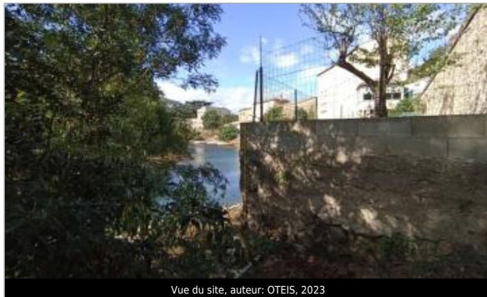
Vue du site, 2023

Coordonnées WGS84 : X: 3.32456320 / Y: 43.72857380