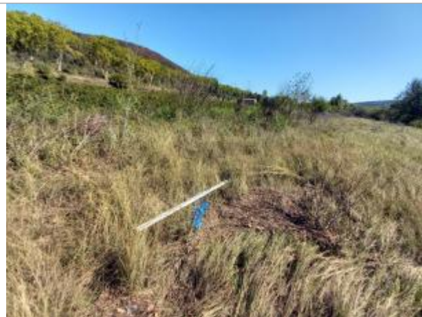
Vue du site, auteur: OTEIS, 2023

Coordonnées WGS84 : X: 3.32461030 / Y: 43.70831290