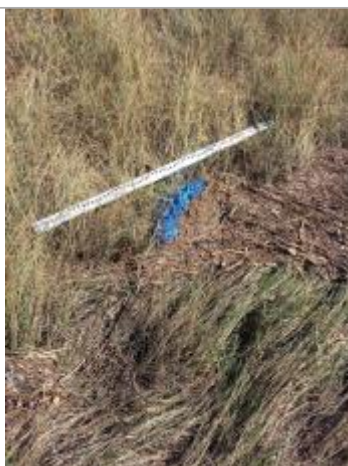
Vue du repère, auteur: OTEIS, 2023