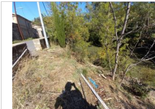
Vue du site, auteur: OTEIS, 2023

Coordonnées WGS84 : X: 3.32084130 / Y: 43.72497940