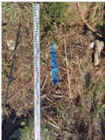
Vue du repère, auteur: OTEIS, 2023