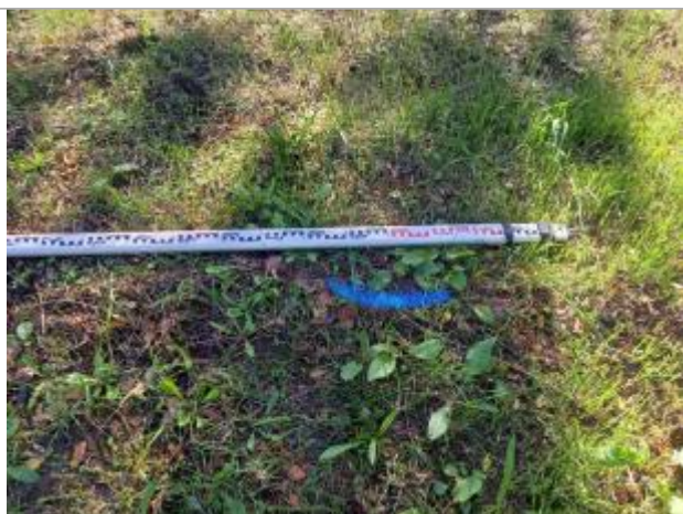
Vue du repère, auteur: OTEIS, 2023