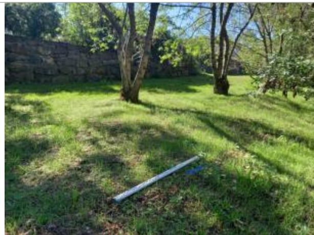
Vue du site, 2023

Coordonnées WGS84 : X: 3.32236300 / Y: 43.72632090