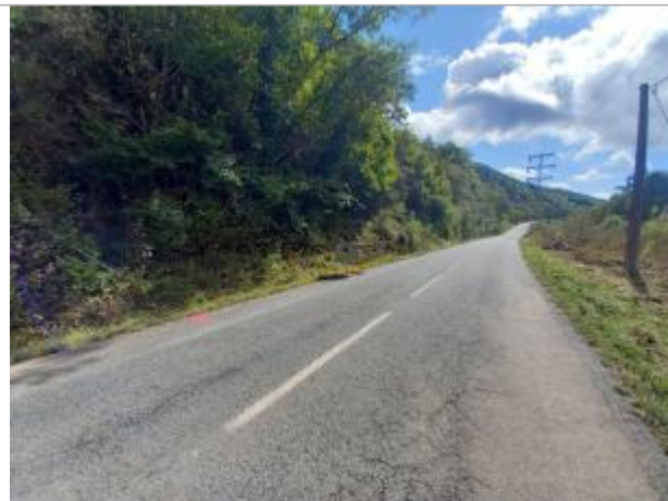
Vue du site, auteur: OTEIS, 2023

Coordonnées WGS84 : X: 3.17919170 / Y: 43.80177480