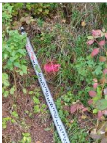
Vue du repère, auteur: OTEIS, 2023