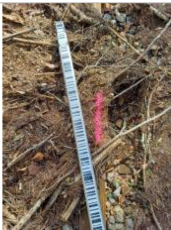
Vue du repère, auteur: OTEIS, 2023